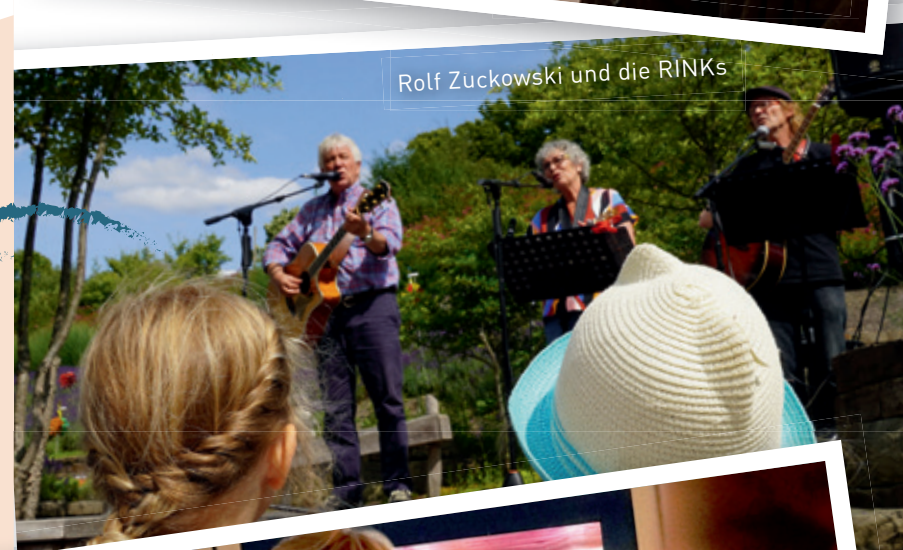
Rolf Zuckowski und die RINKs

Rolf Zuckowski ist seit 2004 prominenter Pate des Kinder- und Jugendhospiz Balthasar und war vor der Coronapandemie regelmäßig im Haus – eine Tradition, die er nun gern wieder aufgenommen hat. „Das Kinder- und Jugendhospiz Balthasar ist ein ganz besonderer Ort, an dem man viel über das Leben lernen kann.“ Übrigens: Wenn Sie wollen, können Sie sich die Weihnachtsbäckerei das ganze Jahr über anhören. Das ist nämlich kein Weihnachtslied, sondern ein Bäckerlied – das hat uns der Sänger persönlich verraten.